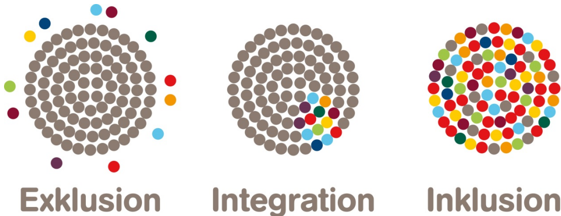
Abb.2: Aktion Mensch (2017). „Inklusion“

„Inklusion ist [demnach] ein in allen gesellschaftlichen Teilbereichen vernetzt verlaufender Wandlungsprozess, der darauf abzielt, jedem Menschen in allen gesellschaftlichen Lebensbereichen auf Grundlage seiner individuellen Bedarfe Zugang, Teilhabe und Selbstbestimmung zu ermöglichen.“ 10