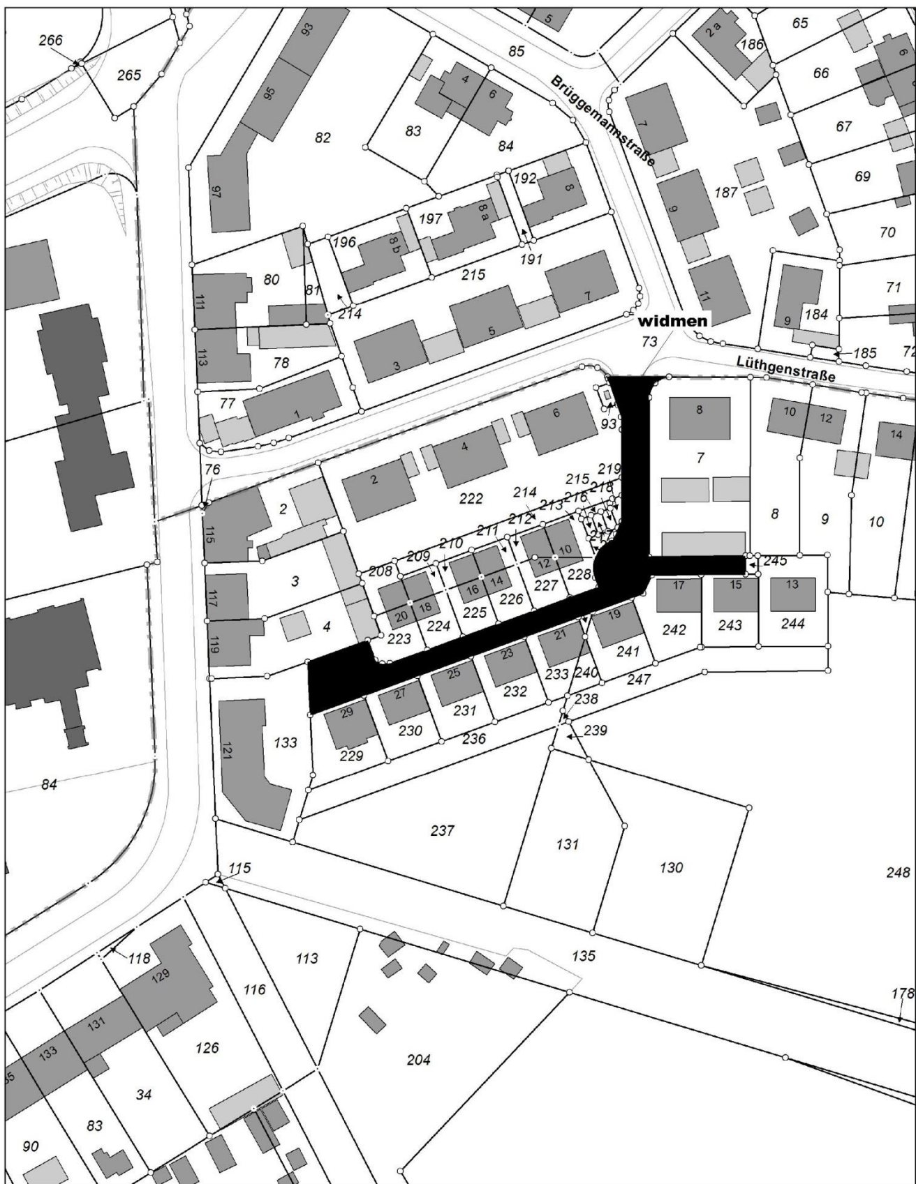
Referat Vermessung und Kataster, Brüggemannstraße, Gelsenkirchen