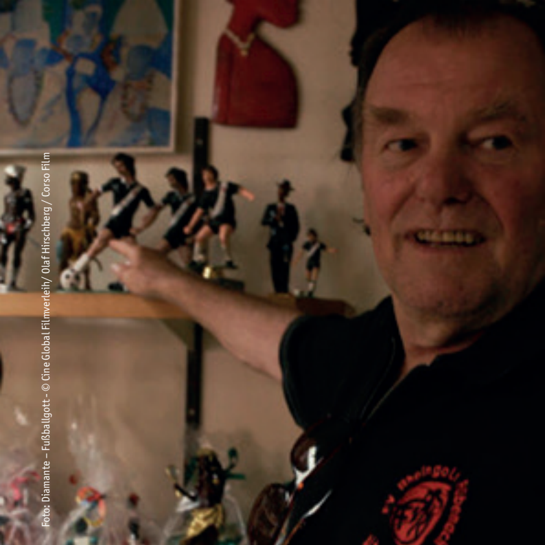
Foto: Diamante – Fußballgott - © Cine Global Filmverleih/ Olaf Hirschberg / Corso Film