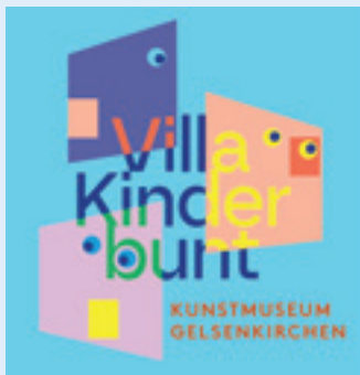
Grafik: Anna Wesek

Bühne frei für die Kinder unserer Stadt: Zum ersten Mal in seiner Geschichte öffnet das