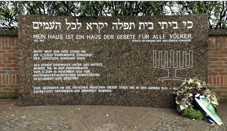
Mahnmal zur Erinnerung an die 1938 zerstörte jüdische Synagoge in Gelsenkirchen-Buer

schen' Kultur sei, sind problematisch. Sie führen zu einer zur kulturalisierten Stigmatisierung von Menschen, die als Muslimas und Muslime wahrgenommen werden, zum anderen verschleiern sie die Wahrnehmung von antisemitischen Vorurteilen und Weltbildern, die sich in allen gesellschaftlichen Schichten finden und nicht typisch für einzelne Gruppen sind. 11