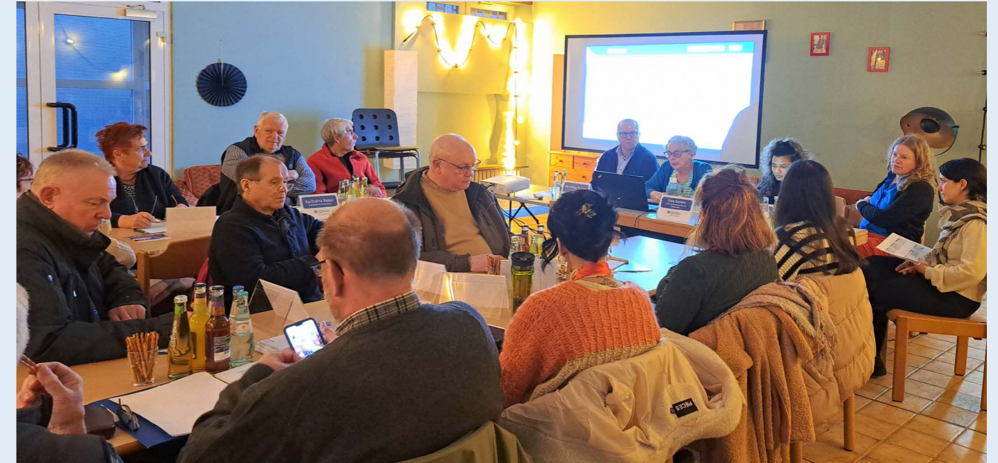
Gebietsbeiratssitzung am 3. März 2024